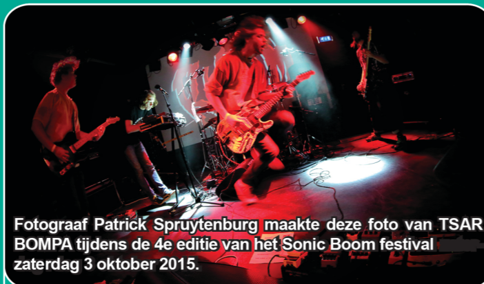
Fotograaf Patrick Spruytenburg maakte deze foto van TSAR BOMPA tijdens de 4e editie van het Sonic Boom festival zaterdag 3 oktober 2015.

TSAR BOMPA: met door wodka doordrenkte stonergrooves. Een gedeelte van de band haalde de skills op het Rock City Institute en die mogen er absoluut wezen. www.tsarbompa.com